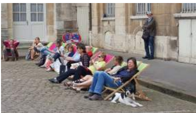
Espace lecture dans la cour de Flore

En confortant l'implantation de Clameur(s) dans le centre historique de notre ville, nous bénéficions de la beauté d'un site classé au patrimoine mondial de l'Unesco.