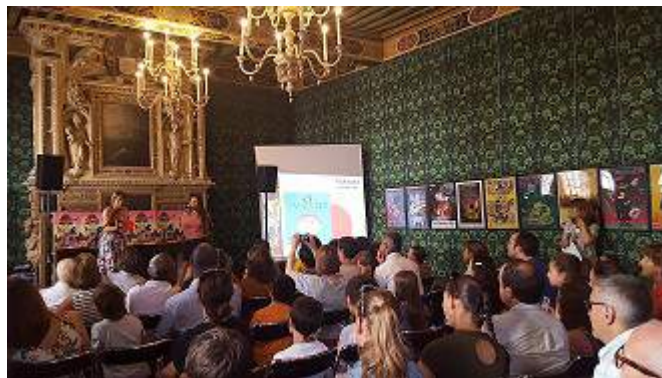
Remise du Prix Sorcières - 2017 // Hôtel de Vogüe