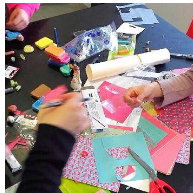
Atelier stop-motion – 2017 // médiathèque Champollion