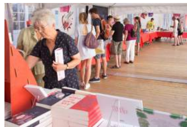
Librairie éphémère cour de Flore